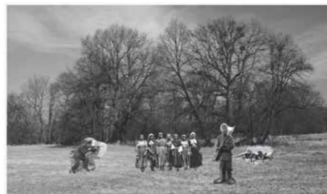
Museum of Ethnology # II