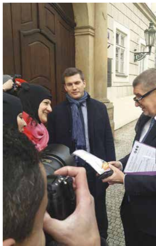
Nödpaket mot Okamura-febern delas ut till parlamentarikerna i Prag 2018.