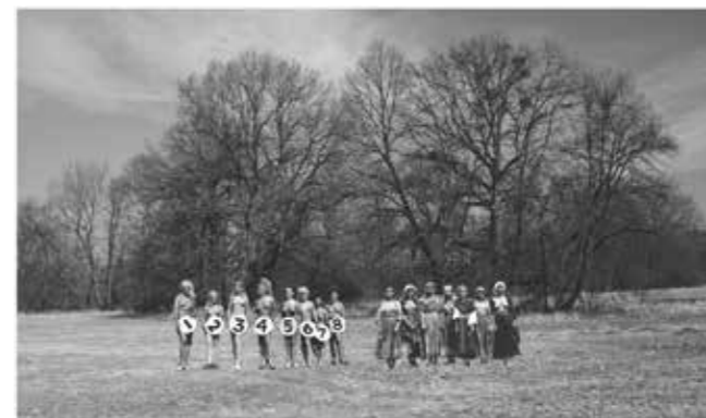
Museum of Ethnology # I