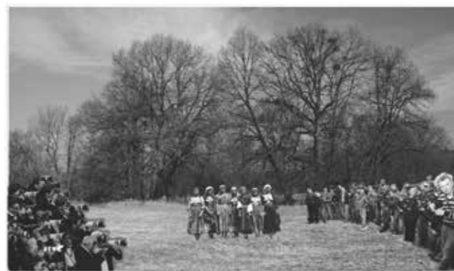
Museum of Ethnology # III