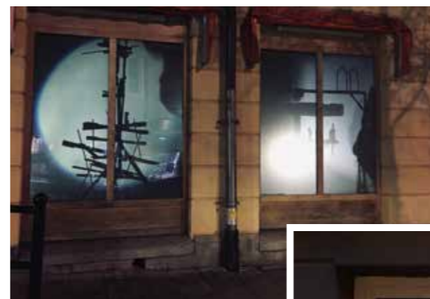
Ekstedt/Andersson. "Skugglek med konversationsfigurer".