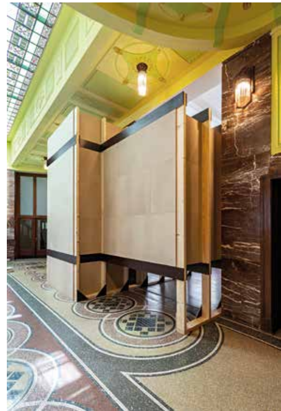
7 Dalibor Bača, Za kulisou , 2020, Galerie moderního umění, Hradec Králové, foto: Zoran Ujević.