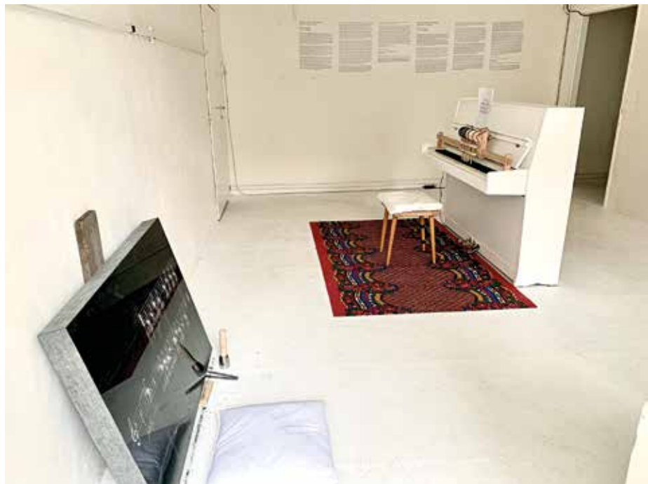
5 Emília Rigová, pohled do instalace výstavy, Artivist Lab, Praha 2020, foto: Tamara Moyzes.